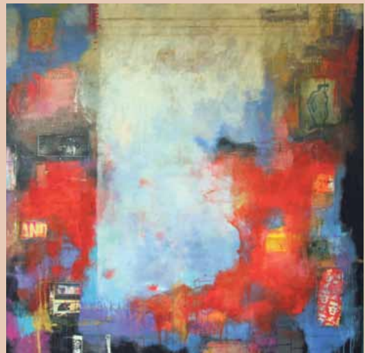
Se utstillingen: GALLERI NOBEL