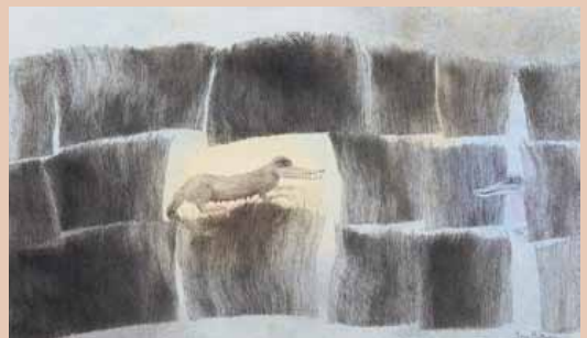
Se utstillingen: KUNSTNERFORBUNDET