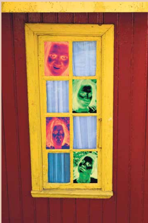
Se utstillingen: RÅDHUSGALLERIET