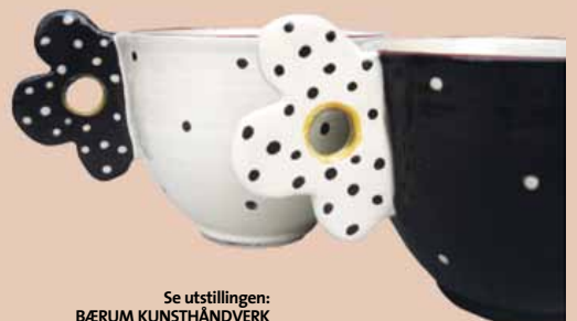
Se utstillingen: BÆRUM KUNSTHÅNDVERK